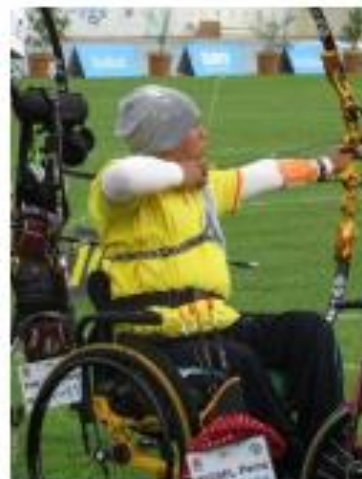
Reposabrazos no actuando como soporte lateral