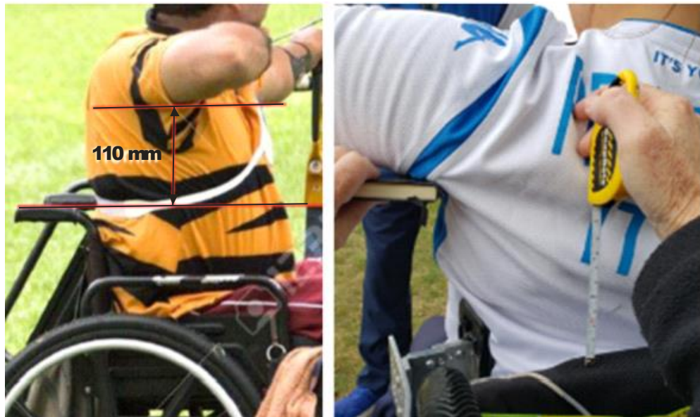
Medida desde la parte más alta de la silla

II. Si un atleta tiene una escoliosis fija y un lado de la silla no cumple con el mínimo de 110 mm, se anotará en la tarjeta de clasificación en la sección de comentarios.