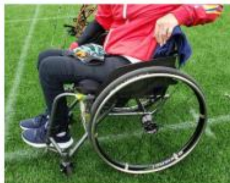
Soporte por debajo de la pelvis