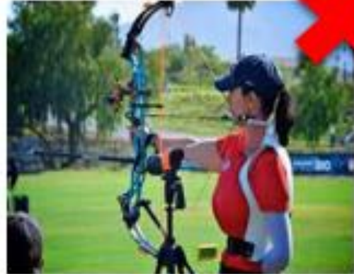
Con soporte del tronco (por debajo de las costillas).