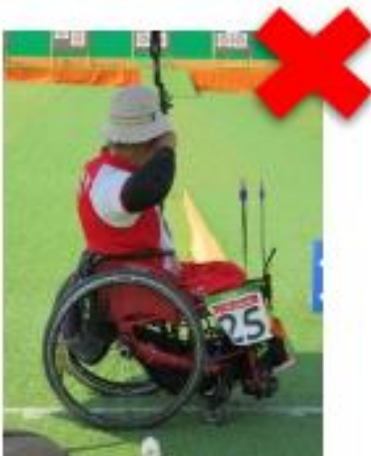
Reposabrazos actuando como soporte lateral. Longitud ilegal.