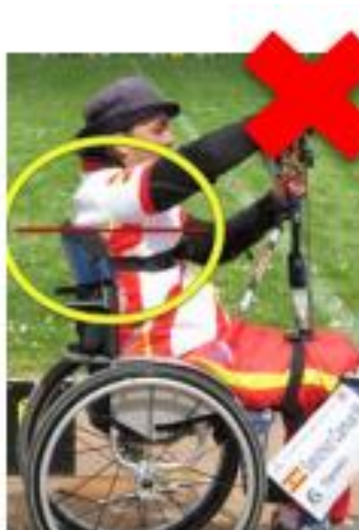
Altura ilegal del respaldo