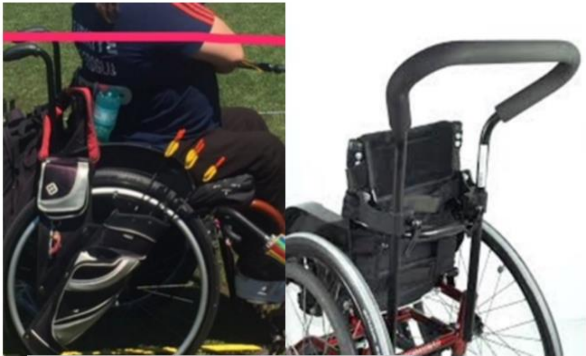
Asideros de empuje no unidos al respaldo de la silla de ruedas