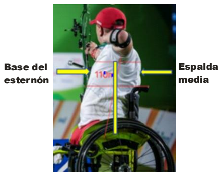
Medición del ancho torácico