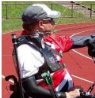
Sin soporte del tronco