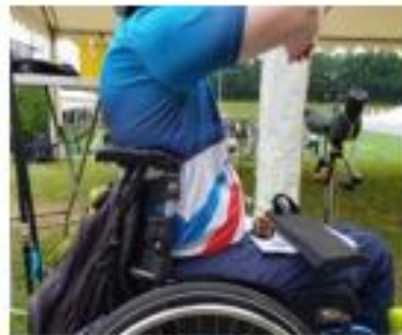
Montantes como soporte lateral