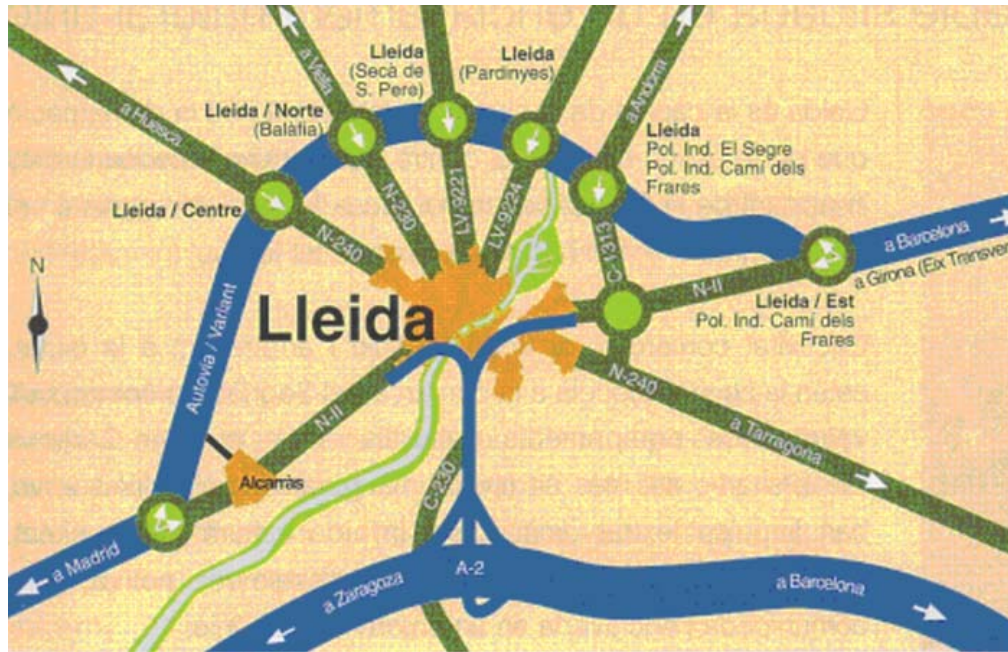
PLANOS DE LOCALIZACION

Aeropuerto de Barcelona..... 165 Km. Aeropuerto de Zaragoza..... 150 Km. Aeropuerto de Madrid..... 460 Km.